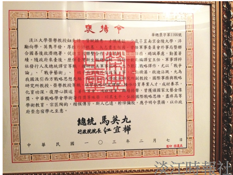
今年2月總統馬英九頒贈褒揚令。