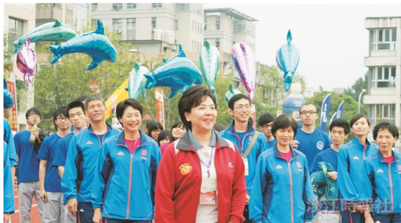
上：校長帶領，全員參與各項體育運動。