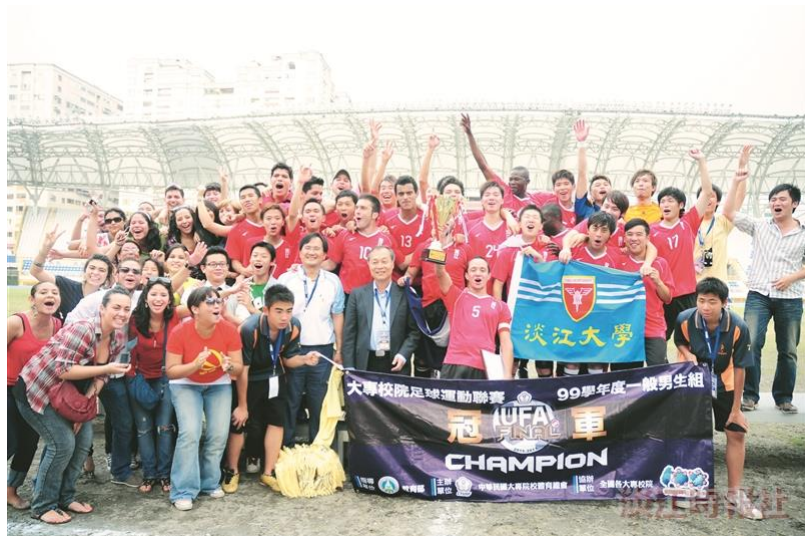
運動代表隊比賽成績優異！