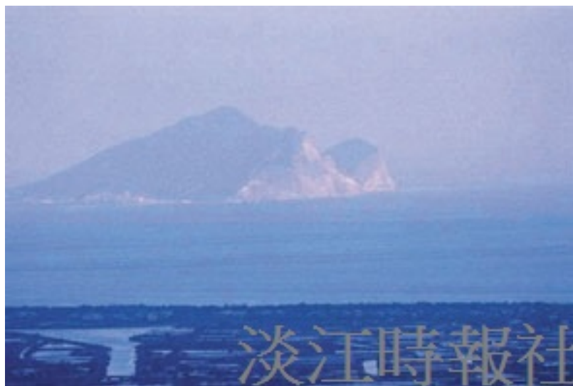
由校園遠眺，二龍河正對龜山島，引人入勝。