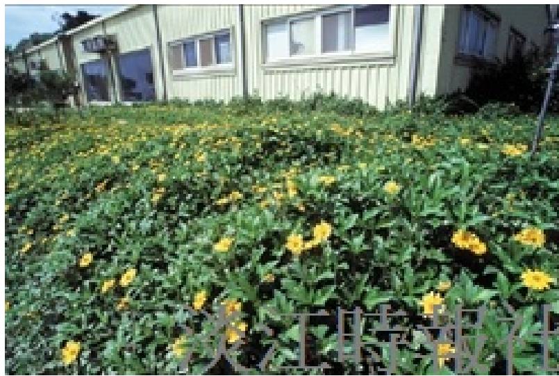
生命力強韌的南美蟛蜞菊在工務所前展露欣欣向榮的笑臉。