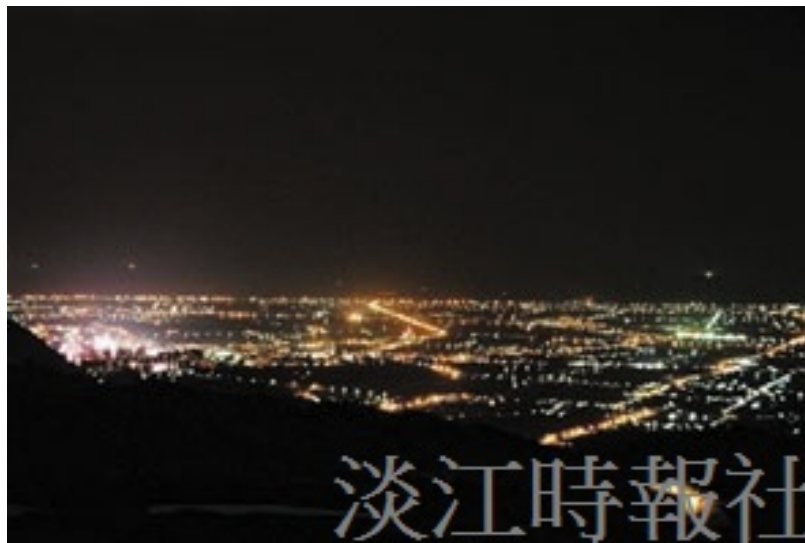
夜景視野自頭城到羅東，燈海壯觀。