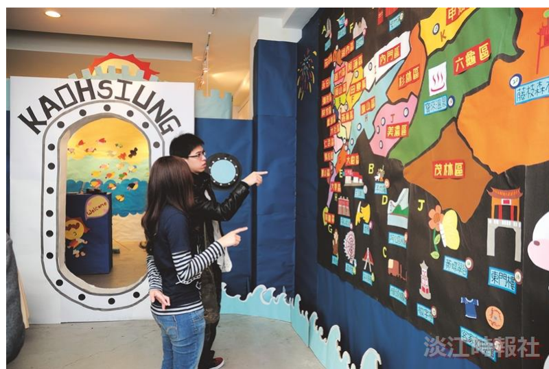
文化週把臺灣搬進淡江