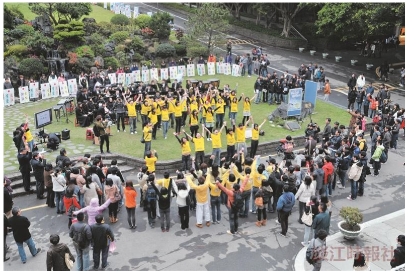
因「日本甘巴嗲，淡江愛很大」為日祈福音樂會及師生捐助等活動，順利傳達日本並收到來自日本國民的感恩明信片，強調臺灣人是最喜愛的鄰國，絕不會忘記這般恩情。