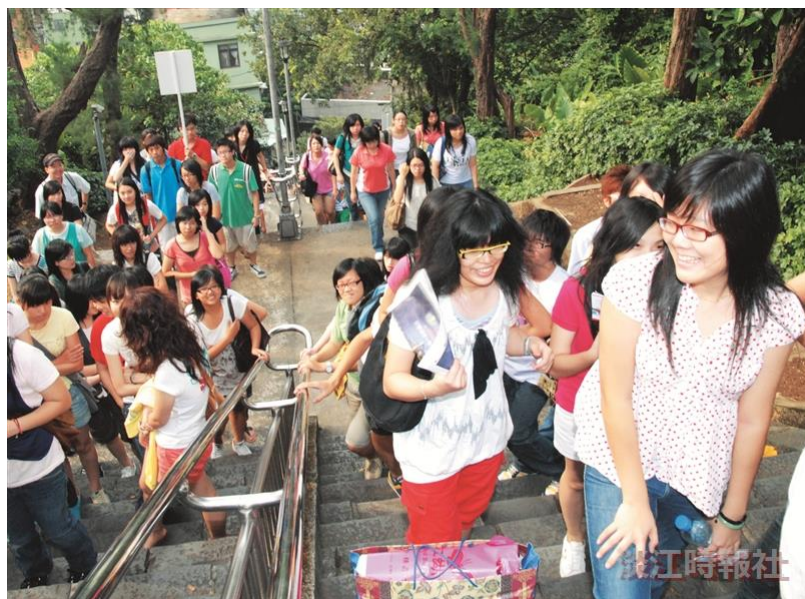
新鮮人克難坡初體驗