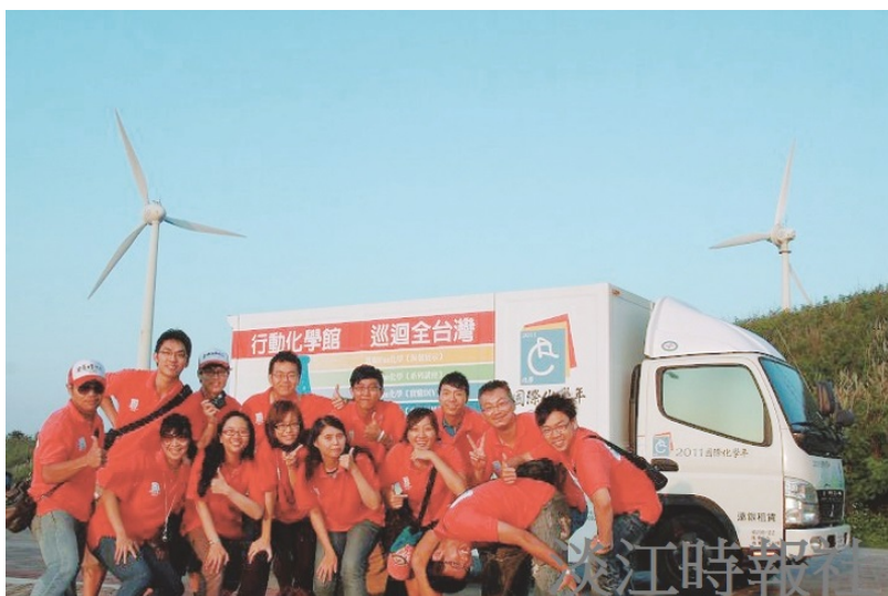
行動化學館第23站鎮海國中志工伙伴留影。（圖／國際化學年辦公室提供）