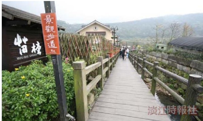
竹子湖海芋季，許多農園皆有開放採海芋，苗榜海芋園是網路上頗獲好評的商家之一。