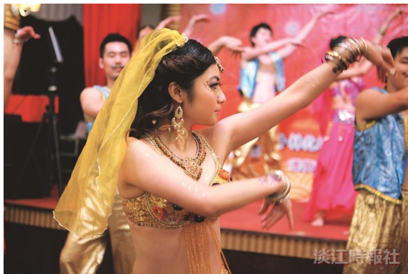
國商所印度舞絢麗多姿，在才藝爭霸中奪冠。（圖／商管聯合碩士在職專班提供）