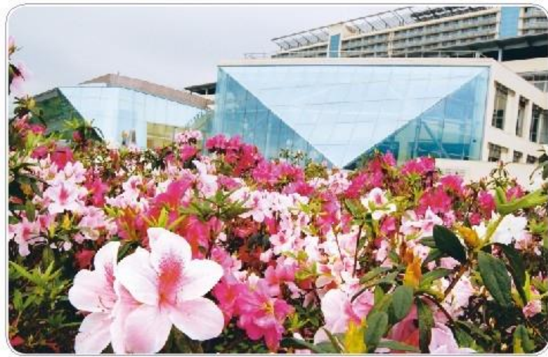
每到春天，蘭陽校園的杜鵑花開，美不勝收。