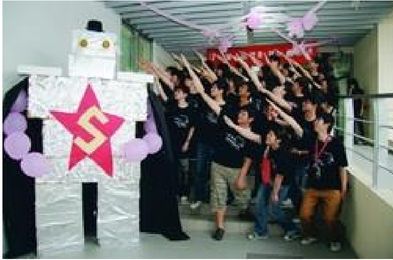
挖寶聖地--蘭陽校園祕笈-資創系體驗營