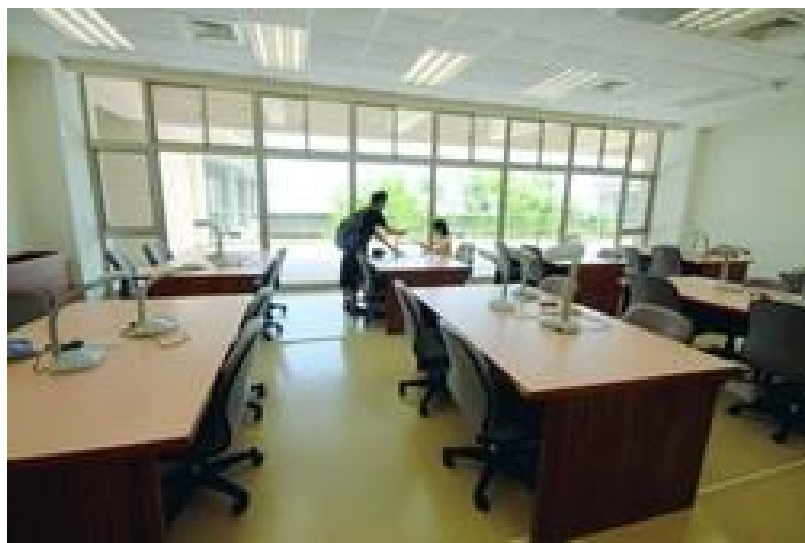
挖寶聖地--蘭陽校園祕笈-自習室