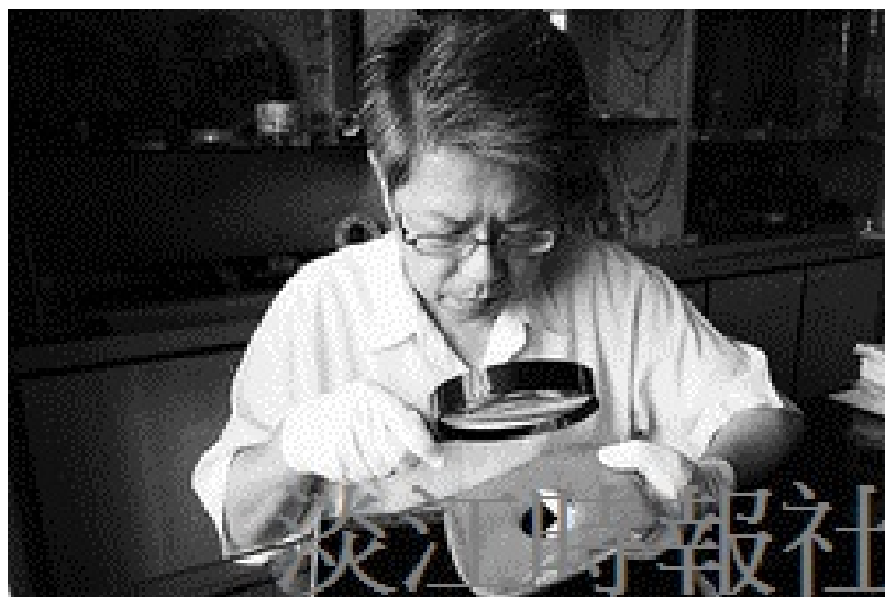
歷史文物研究室