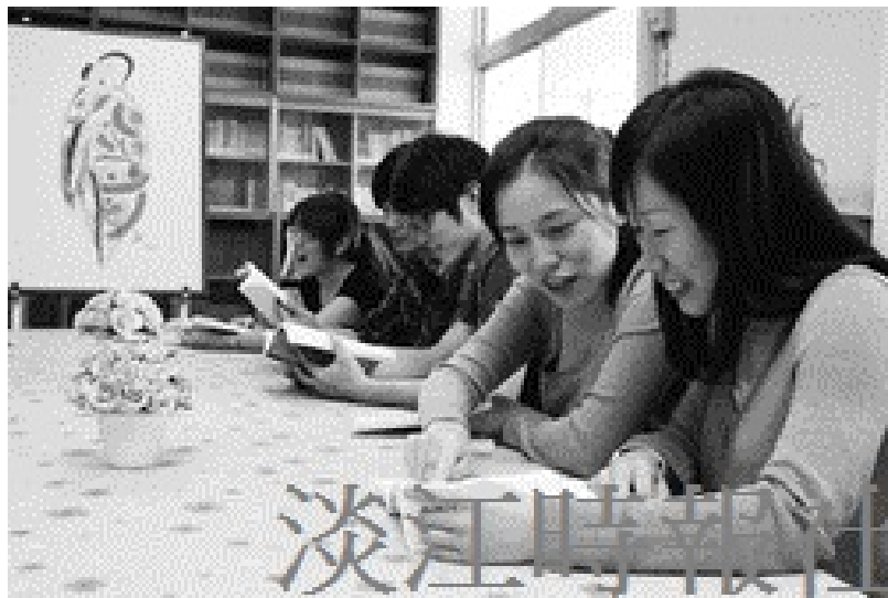
女性文學研究室