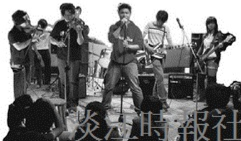
建築系師生自組樂團，舉辦「插一點電演唱會」，用音樂表達「愛淡水」。