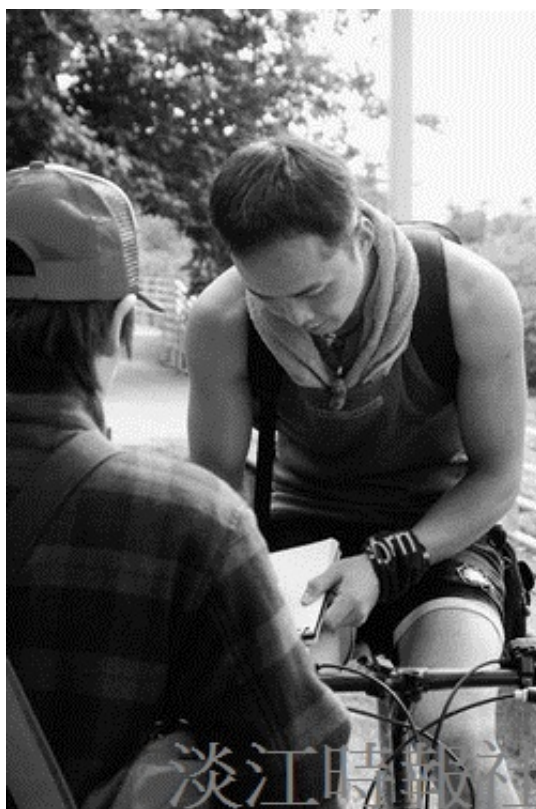
建築系學生透過採訪淡水觀光客，瞭解觀光客對淡水的看法。