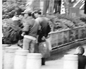
Fig. 2 Homeless people wander around and gather together for chatting.

The favorite haunt for the homeless people is Longshan Temple in Wanhua District. Some of them group around the street to exchange daily information.