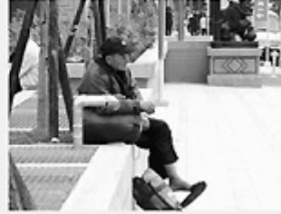
Fig. 3 A homeless man sits by the sidewalk with his sleeping bag and personal belongings packed in a small bag.