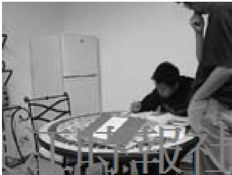
男舍貼心提供的課業輔導。