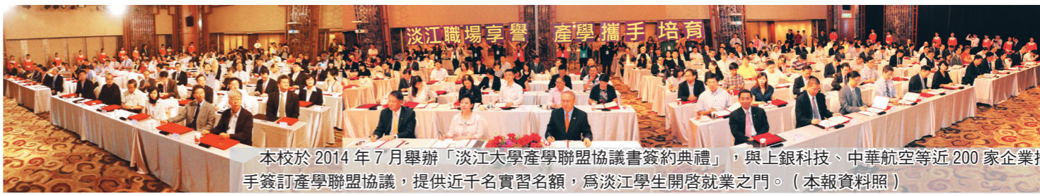
本校於2014年7月舉辦「淡江大學產學聯盟協議書簽約典禮」，與上銀科技、中華航空等近200家企業攜手簽訂產學聯盟協議，提供近千名實習名額，為淡江學生開啓就業之門。