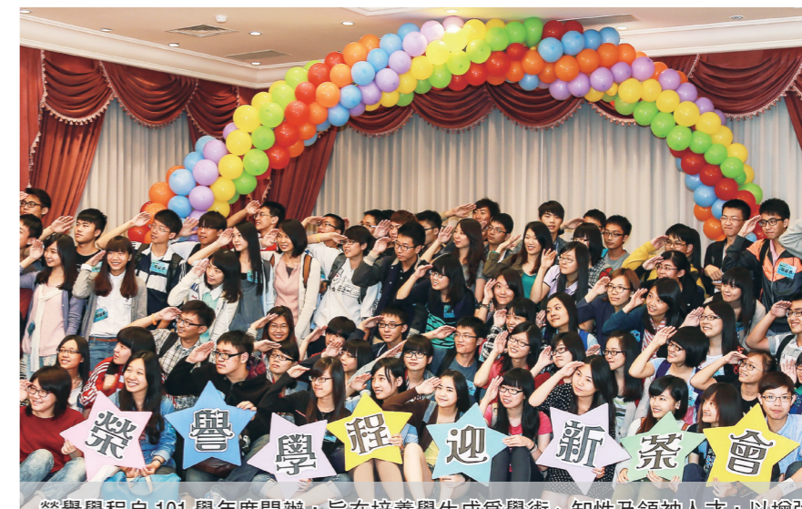
榮譽課程自101學年度開辦，旨在培養學生成為學術、知性及領袖人才，以增強畢業競爭力。