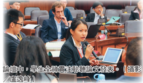
論壇中，學生全神貫注聆聽論文發表。

1月19、20日，在本校覺生國際會議廳、暨聲國際會議廳，分別來自13國13所大學及本校約26位學生參加發表論文及討論。國際暨兩岸事務處校長戴萬欽致詞時表示：「藉由此論壇，可提供本校生及國際生藉不同議題來討論全球發展趨勢，亦可加強學生評論全球化議題的能力。」