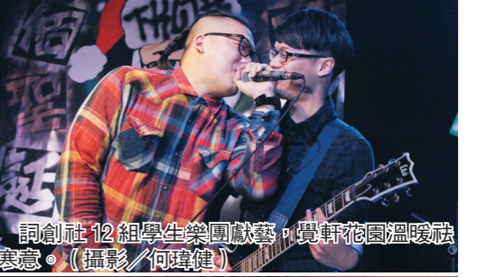
詞創社12組學生樂團獻藝，為覺軒花園溫暖聖誕。