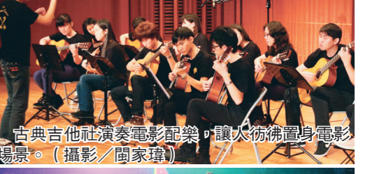
古典吉他社演奏電影配樂，讓大彷彿置身電影場景。