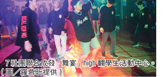
7社團聯合成發「舞宴」high翻學生活動中心。

主題源自近期熱門的網路用語「邊緣人」，藉此主題反襯出社團溫暖如家。表演者皆穿上紅色系衣物，結合聖誕老人形象，用音樂送暖。」西語三江采軒表示，樂團歌曲演繹精湛，大飽耳福，也感受到詞創社溫暖的心意。