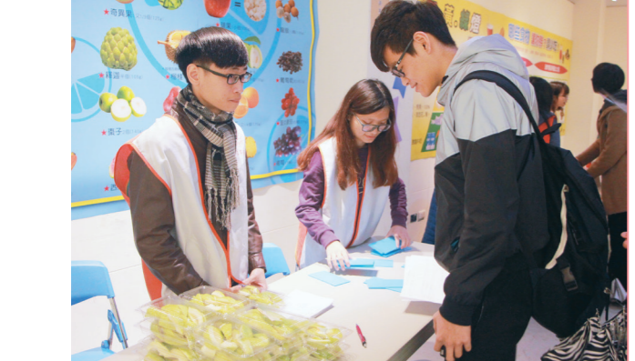
「水果底加啦」活動週，吸引眾多同學參與。