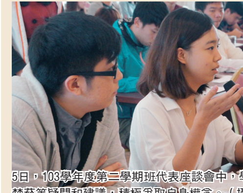
5日，103學年度第三學期班代表座談會中，學生踴躍發言，並提出選課、禁菸等疑問和建議，積極爭取自身權益。

【記者蔡晉宇淡水校園報導】103學年度第二學期「全校二、三年級及研究所班代表座談會」5日在覺生國際會議廳舉行，由校長張家宜主持，學術副校長葛煥昭、行政副校長胡宜仁、教學行政相關單位主管與班代表逾百人出席，與蘭陽校園同視訊。張校長致詞時闡述本校三化等教育理念，更帶領全體師生領受大素養，讓班代表更加認識淡江文化。