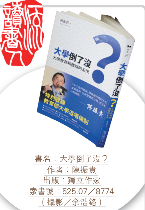
書名：大學倒了沒？ 作者：陳振貴 出版：獨立作家 索書號：525.07/8774