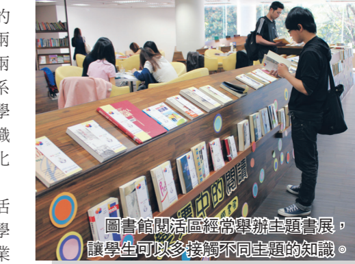
圖書館與社區經常舉辦主題書展，讓學生可以多接觸不同主題的知識。