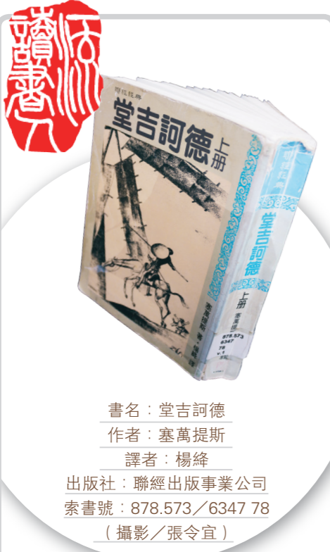
書名：堂吉訶德 作者：塞萬提斯 譯者：楊絳 出版社：聯經出版事業公司 索書號：878.573/6347 78