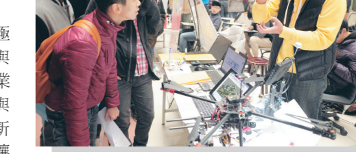
▲電機專題成果展，展示各類研究內容。