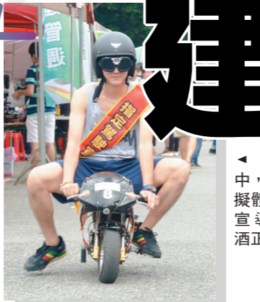
▲運管週中，以3D模擬體驗酒醉，宣導責任飲酒正確觀。

地設計與專業特色相關的互動遊戲，並邀請相關業界演講，或展示特殊專題研究等成果，讓各系能互相交流學術內容。