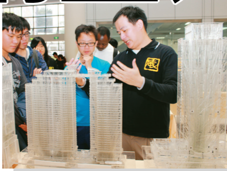
▲風工程週展示高層建築模型，並展示實際應用的商業案例的風力評估、風力設計等，讓師生瞭解風工程研究。

此外，寒暑假會有許多社團組成返鄉服務隊，到各縣市資源較為匱乏之小學，舉辦營隊，帶小朋友玩遊戲，傳授知識，或是組成東埔業服務學習團、海外志工團等出國服務，本校每學期也會選出寒暑假社會服務隊績優團隊，以茲鼓勵。