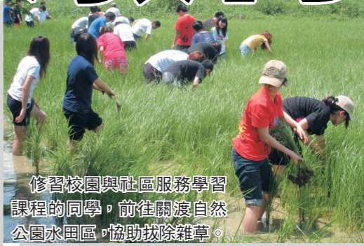
修習校園與社區服務學習課程的同學，前往關渡自然公園水園區，協助拔除雜草。

此外提升職涯輔導工作、營造專業諮詢空間、職涯諮詢服務，以及運用多元職涯測評工具，來引導學生的職涯方向和輔導學生及提早體會職場發展趨勢。同時積極提升各類專業證照取得，各所系將進行專業證照之輔導，培訓教師考取專業證照後，透過各系開設相關課程，來提供學生證照考試資訊及輔導學生考照，進而強化學生實務能力及職場競爭力，如金融和財務證照輔導、外語證照輔導、電腦證照輔導等。目前培訓學生參加電腦技能應用競賽，如世界