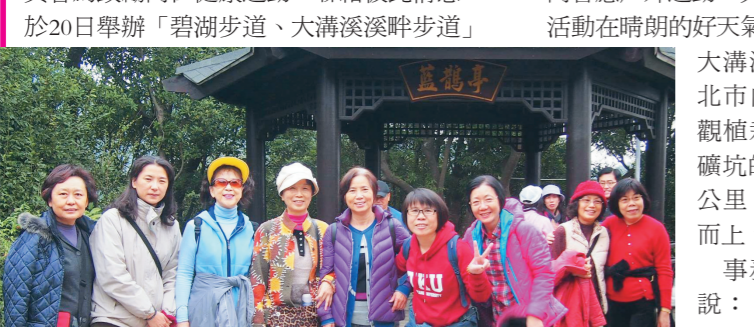
20日，員福會舉辦「碧湖步道、大溝溪溪畔步道」健行活動，不少教職員一同響應戶外運動。