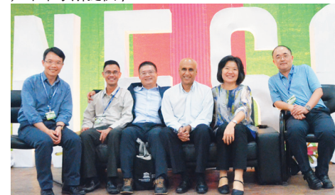
▲未來學所 5位教師再度與 UNESCO 合作，在菲律賓擔任工作坊引導員，並與國際學者合影。