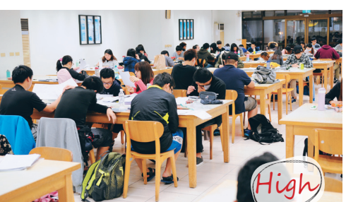
全體拚期中 All Pass 上週適逢期中考週，淡水地區受東北季風影響，天氣濕冷。18日上午，覺生紀念圖書館自習室內大客滿，同學們無畏風雨前往苦讀，希望拚得好成績。(文/卓瑋、攝影/吳國順)

莊希豐更進一步說明，未來會持續努力進用身心障礙者員工，提升身心障礙者工作機會，並向新北市申請職務再設計補助及獎勵金，建構友善環境，維護身心障礙者自立及發展機會。根據人力資源處資料，本校身心障礙員工加權人數占員工總人數的比例由102學年度4.5%上升至4.8%，身心障礙員工平均工作年資也由102學年度9.84提高至9.91。