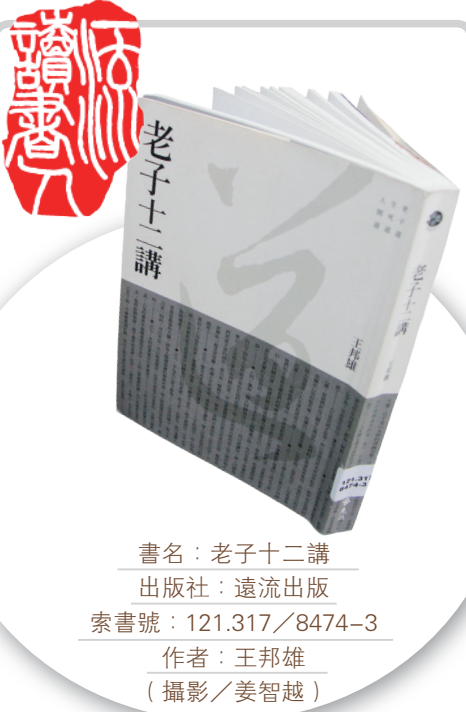
書名：老子十二講 出版社：遠流出版 索書號：121.317/8474-3 作者：王邦雄