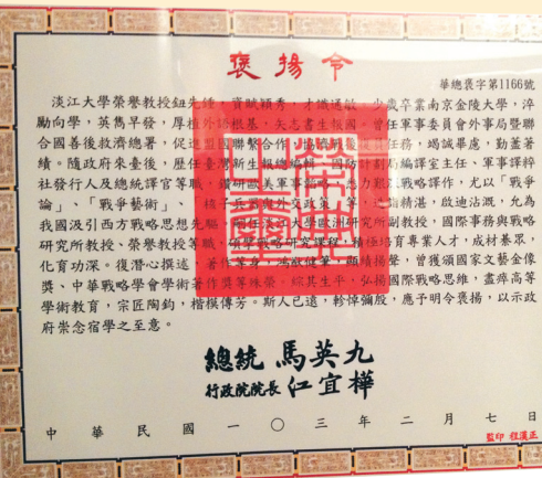
今年2月總統馬英九頒贈褒揚令。

陳榮洋對於老師的尊崇與感恩盡顯於輓聯：「戰略思想能啓通，先生著授居首功。當年幸立程門雪，此刻空懷馬帳風。」懷念起鈕先鍾