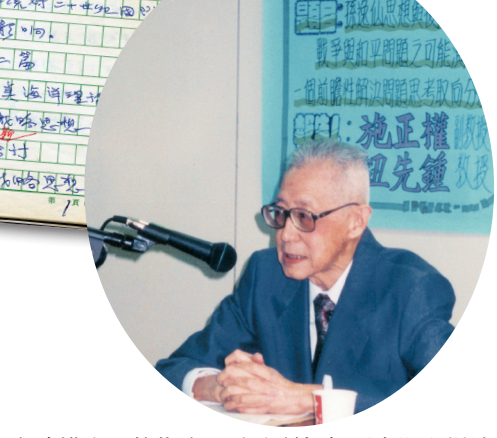
1995年11月27日鈕先鍾受邀參加學術討論會，擔任施正權論文評論人。

在建構中，他指出，戰略所每年不定期舉辦淡江戰略論壇、開設全球化戰略講座課程、舉辦紀念鈕先鍾老師研討會等。不僅如此，戰略所師生將所發表的論文集結成冊，同時出版相關書籍，以展現該學派的學術思想發展。