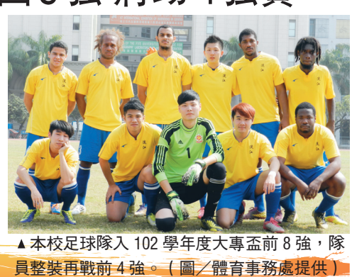
本校足球隊入102學年度大專盃前8強，隊員整裝再戰前4強。

【記者楊宜君淡水校園報導】本校足球隊於上月28日至2日在崑山科技大學參加「中華民國大專院校102學年度足球運動聯賽」晉級複賽，從全國大專院校16支隊伍中獲得前8強殊榮。