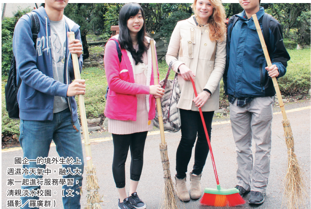
國企一的境外生於上週遇冷天氣中，融入大家一起進行服務學習，清親淡水校園。(文、攝影/羅廣群)