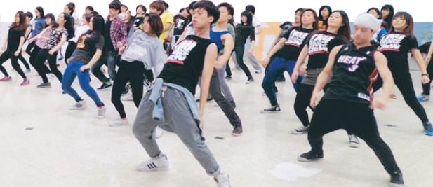
舞蹈研習社寒訓中，以7種舞蹈練習，大家伸展肢體勇於表現自我。

本校星相社、健言社、網球社、羽球社、劍道社、陳氏太極拳社、國術社、跆拳道社、空手道社、內家武學社、馬術社、合氣道社、體適能有氧社、淡蘭排球社、舞蹈研習社、實驗劇團、登山社、國際標準舞研習社、羅浮群、五虎崗童軍團、正智佛學社、合唱團、航大學會、商管學會共24個社團近千人，利用寒假期間舉辦社團訓練，除增進能力外，並活絡社員間的感情。