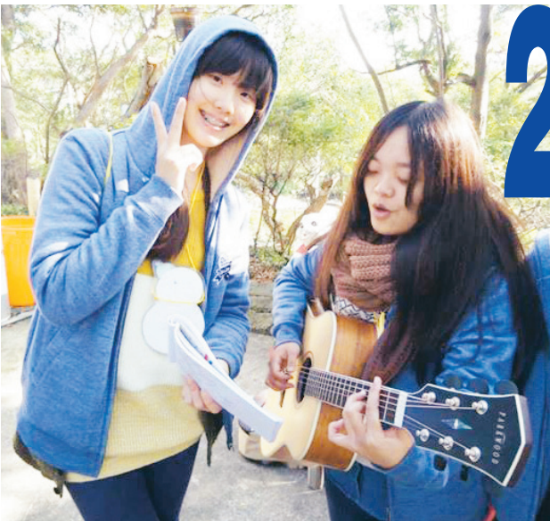
第28屆寒訓吉他營中，大家練習自彈自唱，以音樂交流聯繫情感。