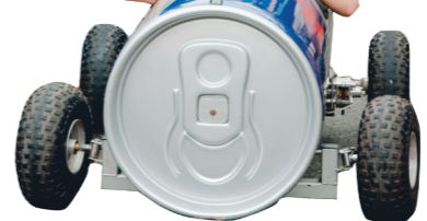
運管週結合電動車駕駛、進口轎車試乘等活動，提醒學生交通安全。

小說、極短篇的投稿量比去年多了1倍。新詩組評審丁威仁表示，本次作品多元，包含線上遊戲、土地關懷等多種元素。