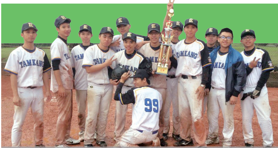
產經系男壘隊在北經盃擊敗多校拿下亞軍,為系上增添獎盃。