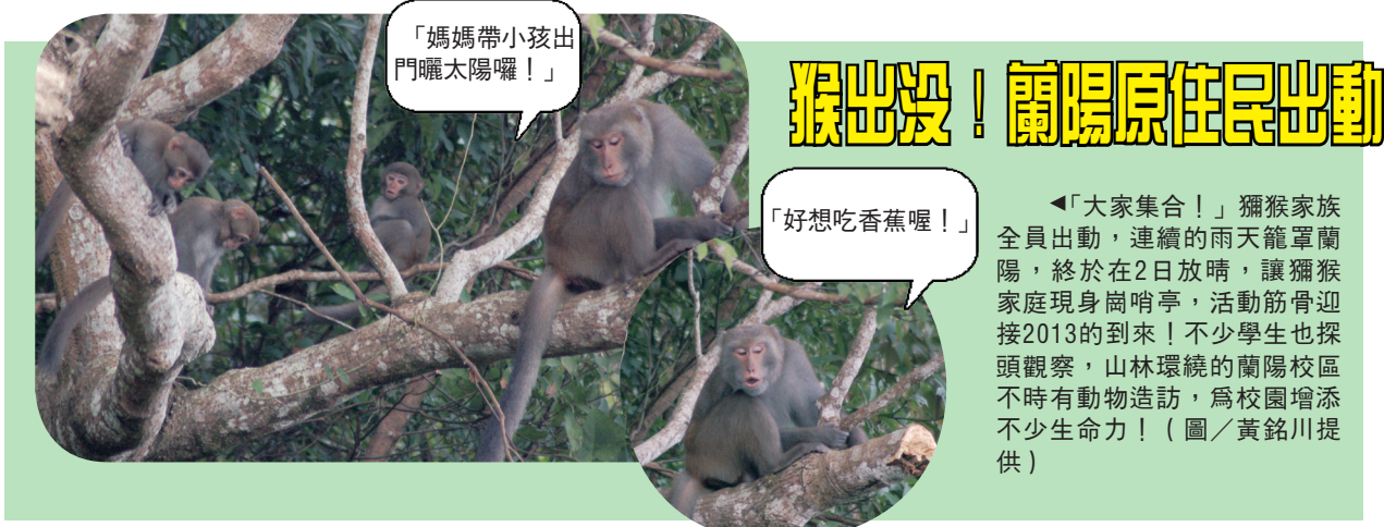
「媽媽帶小孩出門曬太陽囉!」「好想吃香蕉囉!」