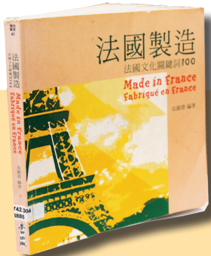
書名：法國製造－法國文化關鍵詞100 出版社：麥田出版公司 案書號：742.304/8885 作者：吳錫德編著

2010年的序言裡則與讀者分享我個人法國文化浸禮的心得。一位學校教育學院的老師很稱許這篇自序說道，我能如此專情於自己的專業，很令她感動……。這本書是我個人接觸法國文化近30年的文化筆記。內容也相當包羅萬象，應該是「哈法族」優先想知道，而且必須知道的項目。此外，它還有一項神奇魔力：看完之後，不僅會讓人主動想去延伸閱讀其他相關的書，還會挑起你（妳）去尋找並寫下第「101」個關鍵詞。