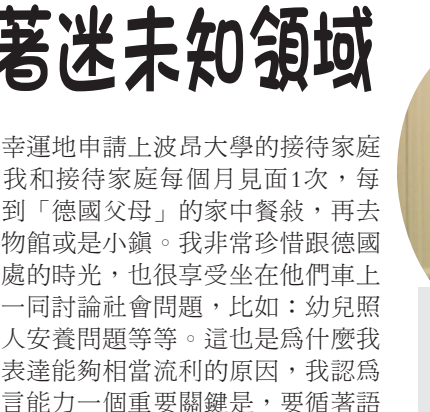
▲德文回于真(中)與德國接待家庭父母，每月聚會分享生活點滴。