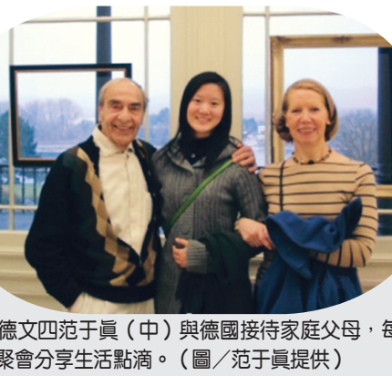
▲德文回于真(中)與德國接待家庭父母，每月聚會分享生活點滴。