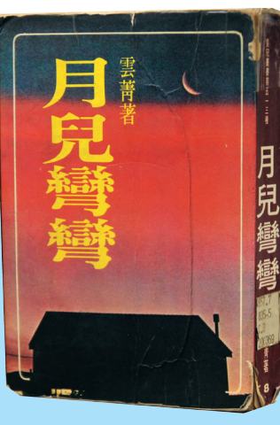
書名：月兒彎彎 出版社：皇冠出版社 索書號：857.7 / 835-5 作者：雲菁 (攝影/李鎮亞)