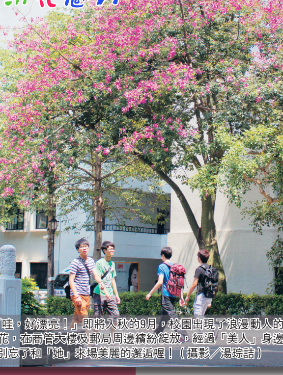
「哇，好漂亮！」即將入秋的9月，校園出現可浪漫動人的美人花。在商管大樓及郵政局周邊綻放綻放。經過「美人」身邊時，別忘了細「她」窺場美麗的邂逅喔！！