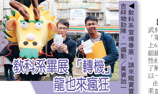
▲教科系宣傳單，請來龍賞寶

【記者梁凱萍淡水校園報導】2012，教科系將運用創意點亮曙光。教科系第十二屆畢業專題成果展「20E2·轉機」將於20日至23日，在黑天鵝展示廳展出，並於20日中午12時10分舉辦開幕典禮，擬邀校長張家宜、學術副校長虞國興等，以及企業合作代表皆會到場參與。