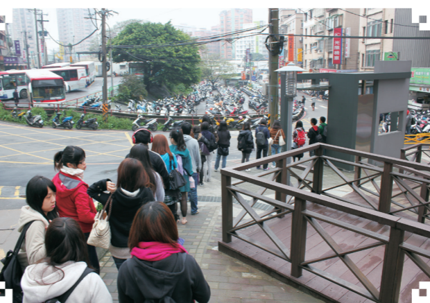
▲指南客運淡水總站旁新建完成的公車亭，讓師生的候車動線更加井然有序。

安全。也有36%的同學對於「實用性」表示讚賞，並認為搭車動線更為流暢，節省不少時間。最後，則是有8%的學生對於公車亭的外型感到美觀，而具有質感的走道則是讓公車亭充滿「設計感」。