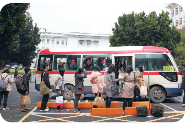
▲淡水客運紅28希望藉由增開班次及延伸路線的方式，有效落實師生共乘制。

學生專車於臺大正門左側的捐血車旁上車，行經臺北校區、新生高架橋，直達淡水校區，一天有6個班次。詳細公車時刻表可上網至學務處生輔組查詢。除此之外，通勤族還能選擇自臺北車站北門發車的756公車（原名2056），可以一路從臺北車站搭到淡水校區，多種選擇提供給公車、捷運通勤族最便捷的往返！