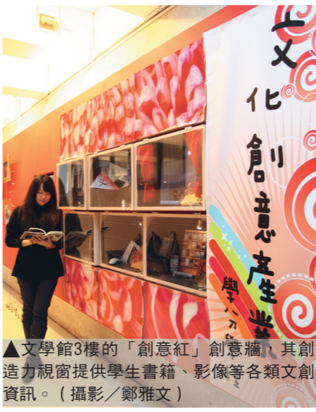
▲文學館3樓的「創意紅」創意櫃，其創造力視窗提供學生書籍、影像等各類文創資訊。

為培養學校更多有潛力的創意人才，文創中心也舉辦「創意前線(L.A. Front)」徵才、「Dual Cultures文化創意產業學座談會」等活動，提供有興趣的學生加入創意人的行列。