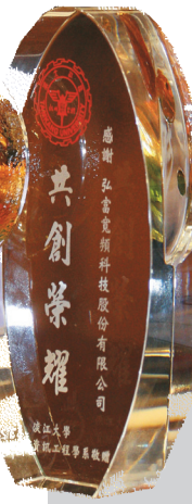
▲資工系贈與企業的感謝牌。