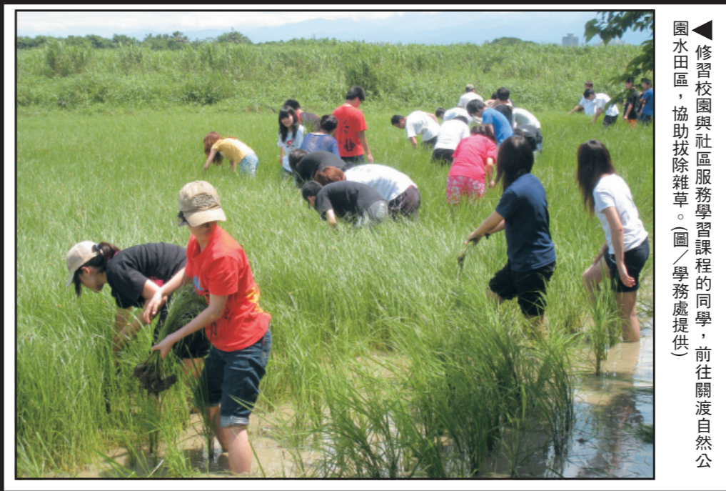
▲修習校園與社區服務學習課程的同學，前往關渡自然公園水田區，協助拔除雜草。(圖/學務處提供)

99學年「校園與社區服務學習」課程主題之一的「友善地圖」，地圖建置從校園延伸到社區，將拓展至淡水老街、英專商園及本校周邊社區。本校與行無礙資源推廣協會淡水服務中心合作，將所發現的無障礙地點繪製於地圖上，並加上鄰近廁所及公園等休憩情報，完成友善地圖。另外，也與中華美國無障礙科技發展協會