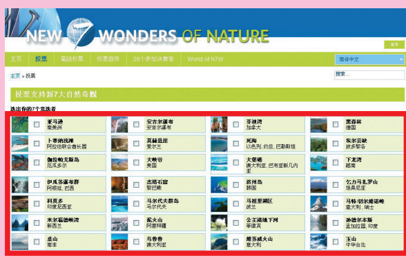
▲步驟一：輸入網址後，直接勾選7項，記得勾玉山。

只要三個投票步驟，就可以將玉山挺進世界7大奇景，請大家趕快告訴大家！投票網址： http://www.new7wonders.com/vote-zh?lang=zh-hans 。