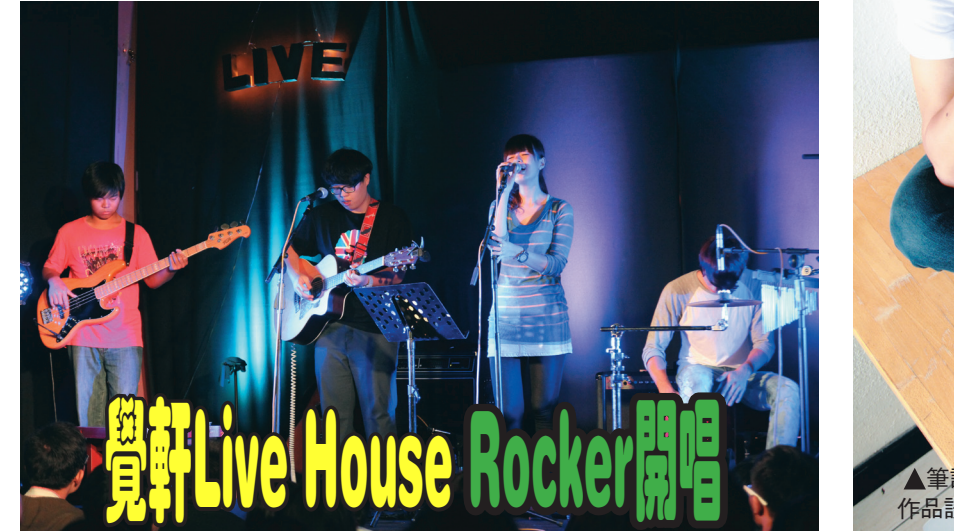
▲獨立音樂表演「覺軒Live House」在覺軒花園熱血演出，由Vast & Hazy揭開序幕，現場擠進近百人搶聽現場演唱！