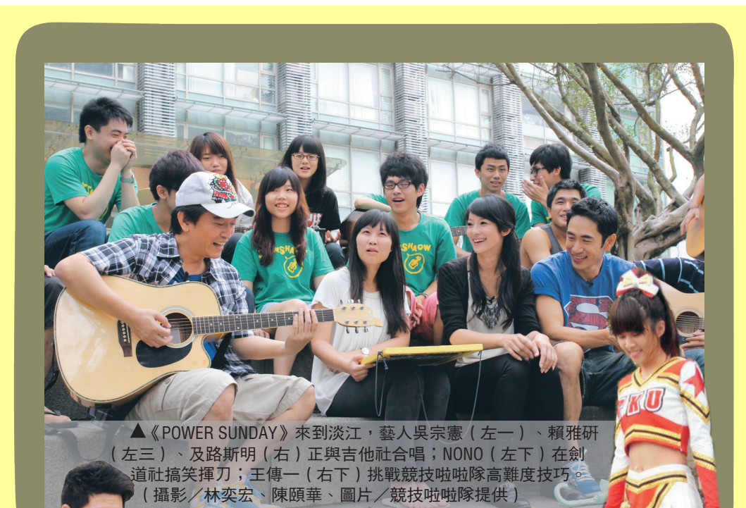
▲「POWER SUNDAY」來到淡江，藝人吳宗憲（左一）、賴雅妍（左三）、及路斯明（右）正與吉他社合唱；NONO（左下）在劍道社搞笑揮刀；王傳一（右下）挑戰競技啦啦隊高難度技巧。