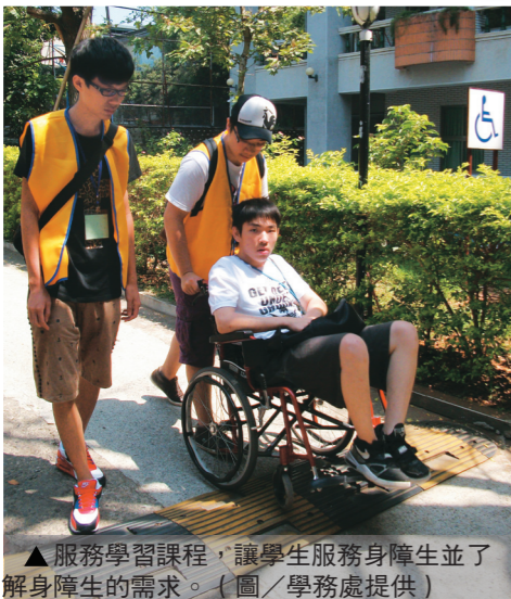
▲服務學習課程，讓學生服務身障生並了解身障生的需求。

【記者藍碩琳淡水校園報導】為推廣校園與社區服務學習，學生事務處與淡水古蹟博物館、行無礙資源推廣協會及統一超商鄰里文教基金會合作，於17日引領航太系、產經系、電機系等111位新生，參與「淡水古蹟無障礙之旅」以及2011 Clean Up the World「清潔地球 環保臺灣」全國清掃活動，透過與校外公益社團的連結，學習互助合作的服務精神。 服務學習自99學年度全面實施，課程共區分為「專業知能服務」、「校園與社區服務」、「社團服務」三類。「專業知能服務」即是結合課程所學知能，如「兒童文學」將至馬偕兒童病房為病童讀童書、「資訊數位服務」將到淡水區公所協助建置網路系統，讓專業在服務中發揮最大功效；「校園與社區服務」是參與校園清潔維護和社區服務等協助，讓大學新鮮人培養服務的基本態度，如淨灘、訪視長輩、