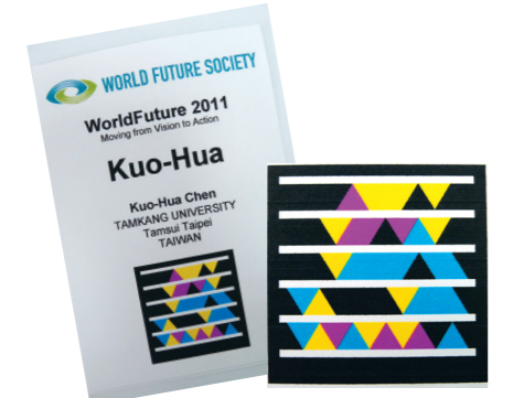
▲今年未來學年會的識別證上多了有擴增實境功能的彩圖，可用智慧型手機讀出資訊(圖/張峻銓翻拍)

除了這些原則，也要能適時且堅定地說「不」，才不至於讓自己負荷過重；別在不自然的情況下，仍勉強執行計畫，有時休息是為了走更遠的路；了解自己的工作(讀書)習慣，融入自己的風格會使計畫完成更輕鬆有趣！花些時間，想一想，找出真正在乎且重要的事，動機是左右行動的重要關鍵；學習有效地運用每一分每一秒，即使零星的小片段也應善加利用。