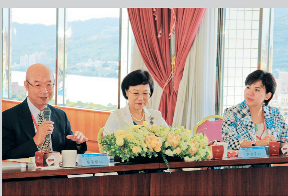
▲ 監察院委員趙榮耀（左一）、尹祚芊（左二）在教育部高教司長何卓飛（右圖）陪同下蒞校，為「國際化及少子化教育措施」作現況訪查。

【本報訊】本月14日監察院委員趙榮耀、尹祚芊一行三人，於上午10時至本校覺生國際會議廳進行「國際化及少子化教育措施現況」訪查，另有教育部視查人員高教司司長何卓飛等與會。會中由校長張家宜致詞、3位副校長及多位一級主管共同參與，訪查內容包括了解張校長的簡報，以及與本校相關人員進行意見交流；接著下午由張校長帶領外賓前