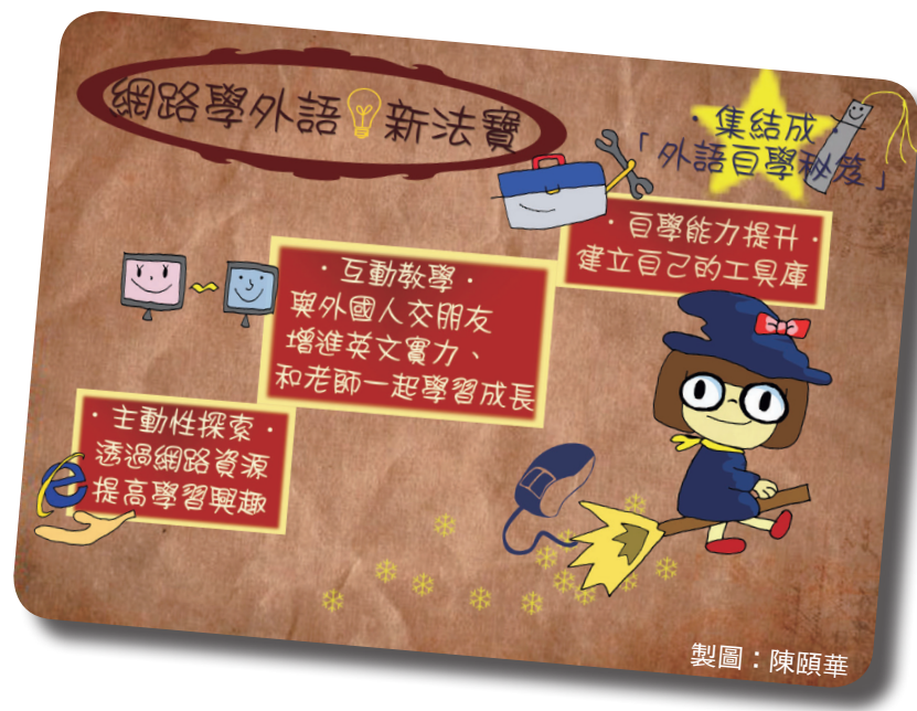
網路學習外語三大秘笈：主動探索、互動教學與提升自學能力，集結成自學秘笈，讓外語學習更easy。

訊、影音、語言使用類等，不但在教學上能有更精確的教導，也為教師省下備課時間。我也藉由此次的交流，學習選擇對學生真正有幫助的教學網站，例如網站本身涵蓋範圍太廣，且過於籠統，便不適合學生，因為學生將無法深入進一步的學習，應選擇專門且能深入的學習網站。 而在我目前英文實習課程中，多半以聽力為主，我會推薦五個不同程度的網站，供學生依照自己的能力去學習使用。學生自學能力依照每個人對學習的態度不同而有所差異，但目前學生回饋大致都有不錯的反應，不少同學會針對自己的需求去尋找資源，例如：針對英檢考試、聽力加強等不同能力的訓練。因此我認為，學生的程度可以利用不同網站資源去滿足，對於不同弱點加強的需求，也能有各種工具進行加強，老師可以擔任此一啟發角色，帶領學生做自我的學習。