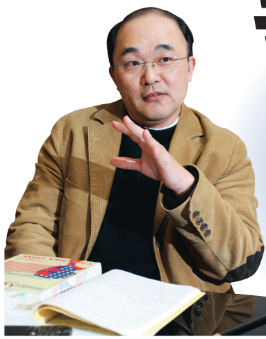
記者／翁浩原