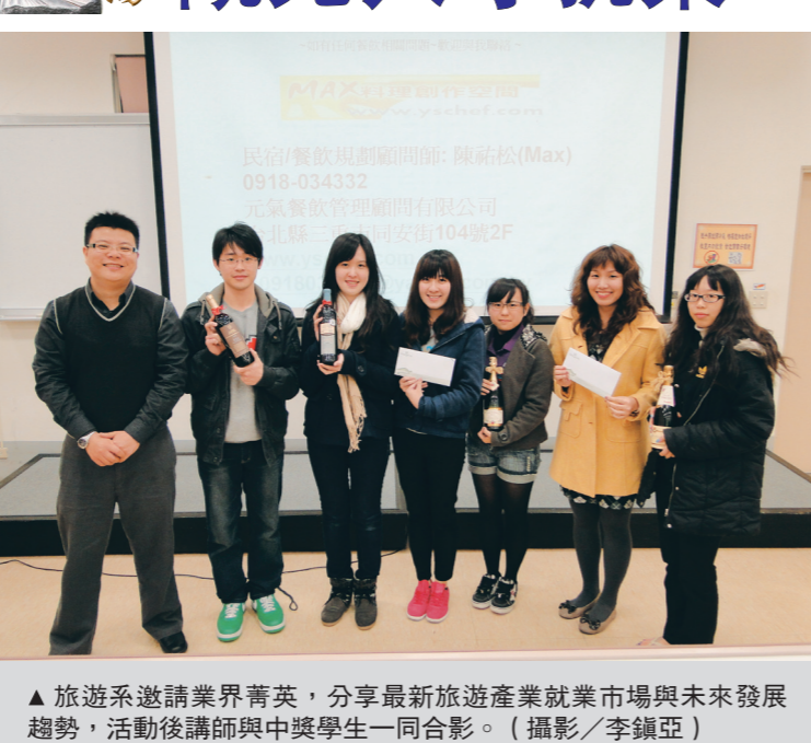
▲旅遊系邀請業界菁英，分享最新旅遊產業就業市場與未來發展趨勢，活動後講師與中獎學生一同合影。