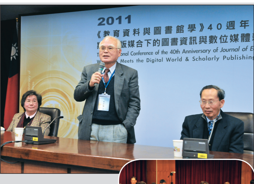
資訊與圖書館學系於3月7、8日在淡水校園...