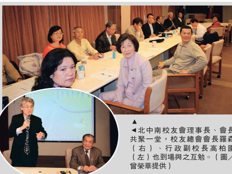
北中南校友會理事長、會長共聚一堂...