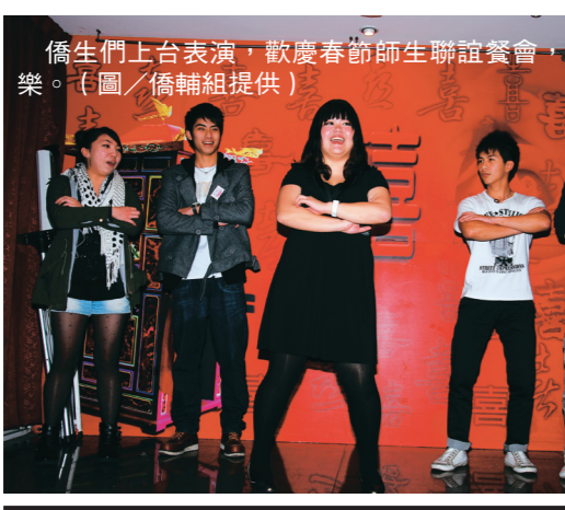
僑生們上台表演，歡慶春節師生聯誼餐會，氣氛十分歡樂。

【記者梁凱雯淡水校園報導】99學年度僑生春節師生聯誼餐會，於上月14日在淡水潮香餐廳舉行，校長張家宜、行政副校長高柏園、僑民教育委員會簡任秘書吳瑞謀、中華民國僑務委員會參事郭大文等人到場致詞，張校長開心地說：「今年來的人數多、特別熱鬧！」郭大文說：「希望每位僑生畢業後，不管在何處發展，都可以把台灣當作是自己的一部分。」