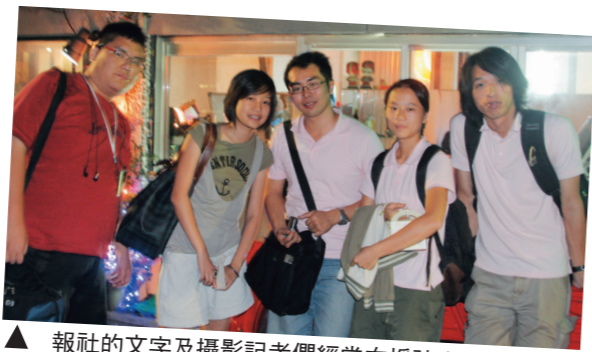
▲報社的文字及攝影記者們經常在採訪之餘聚會。