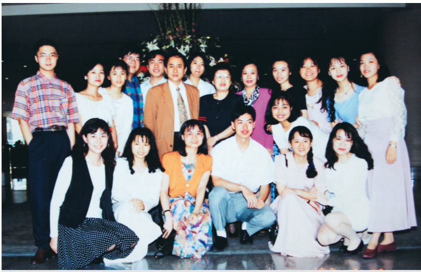
▲曾在淡江時報社工作的同仁和新研社已畢業同學，經常安排聚餐，圖為82年5月在台北麗晶飯店聚餐。