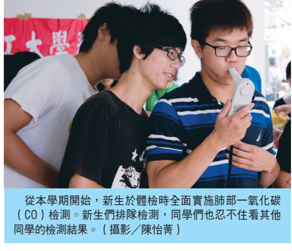
從本學期開始，新生於體檢時全面實施肺部一氧化碳(CO)檢測。新生們排隊檢測，同學們也忍不住看看其他同學的檢測結果。