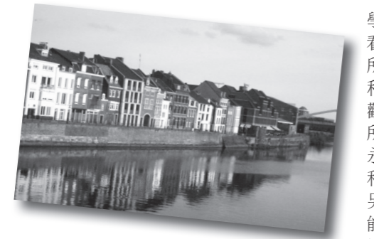
▲馬斯垂克是荷蘭的古老小城，風光明媚。

來到國外的目的不是學習別人，而是認識自己。藉由觀看他人，我看到自己的優點，也看到自己不足的地方。因為旅行，我看見家鄉。今天是我來到歐洲第120天，上週我買了第一支鬱金香，橘色的花，擺在我的窗邊，窗外的風景看久了也就熟悉。目前還不想家，但我開始懂得珍惜自己來自的地方。