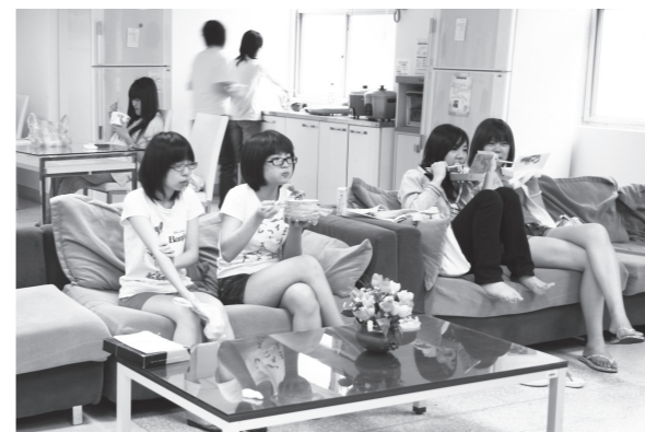
▲自強館內的交誼廳是住宿女同學們看電視、聊天，放鬆身心的好所在。