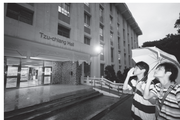
▲七、八〇年代，男同學在自強館外叫館的樂趣，畢業系友至今仍津津樂道。