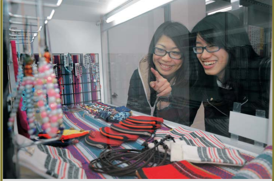
▲本校位於商管大樓舊書城旁的格子舖上週開張，學生創作的物品琳瑯滿目，吸引許多師生駐足觀看。(圖/洪錫凱)

相對更大！」 中文二蕭賢睿表示，改革後的通識教育課程，相較於目前的前七後五學門，分類更為清楚，同學也更容易了解，且必修學分減少，有更多時間選擇自己有興趣的課程，「這點很棒！」